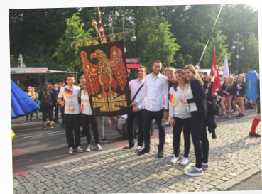
FESTUMZUG BEIM DEUTSCHEN TURNFEST IN BERLIN