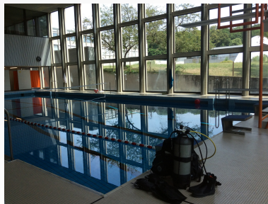
DREHTAGE DER FILMAKADEMIE