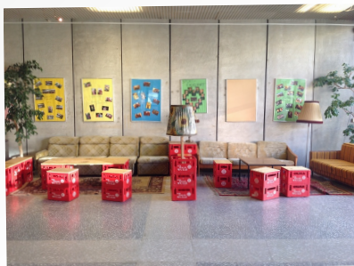
Wulle-Wohnzimmer beim Barockturnier

Zum Abschluss glänzte das 21. PHarrieté von Rüdiger Hein im Januar.