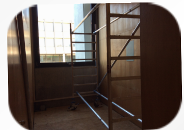
TRAININGSGERÄTE FÜR BÜROS

Galt ab dem 10.11.2017 auch für Menschen!