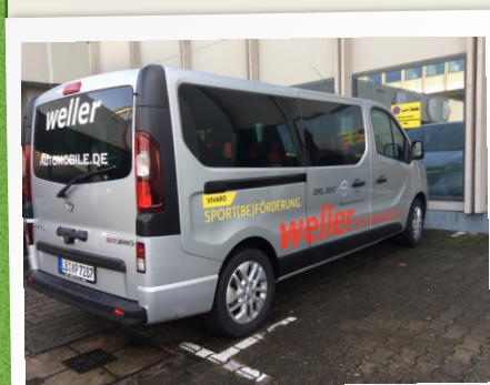
SPORT(BE)FÖRDERUNG für neue Bewegungserfahrungen

So erhielt das Wort „Sport(be)förderung“ eine ganz neue Konnotation.