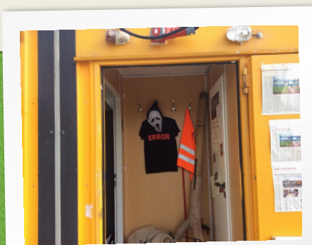
ESCAPEROOM FÜR INDOORERLEBNISSE