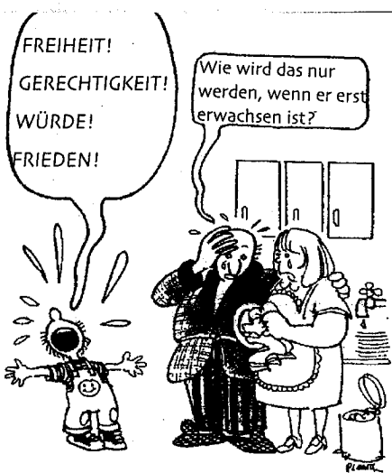
Titelzeichnung: Plantu. Zuerst erschienen in "Le Monde". Abdruck mit freundlicher Genehmigung.